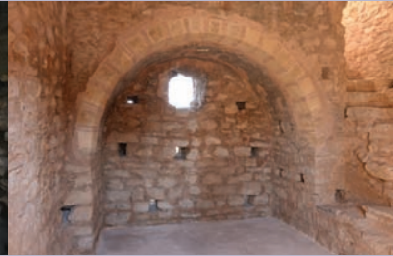
Επάνω: Εσωτερική άποψη της πρώτης στάθμης του νοτιοανατολικού πύργου Above: The first floor of the southeastern tower during and after the restoration