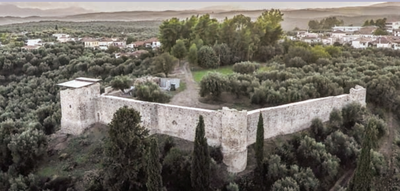
Αεροφωτογραφία του κάστρου από τα βορειοανατολικά μετά τις εργασίες αποκατάστασης Aerial view of the castle from the northeast after the restoration

From 1417 Androusa remained under the control of the Despots of Mistra for a few decades. Afterwards it was conquered by the Ottomans, following the fate of the rest of Peloponnese. During the next centuries, Androusa, becomes a bishopric and emerges as an important administrative center of the Ottoman-held Messenia. It was also the seat of an administrative district (territorio) during the second period of Venetian rule (1685-1715). Its fortification, however, gradually loses its defensive significance. Consequently from the beginning of the eighteenth century the castle lies in ruins. The ground plan of the curtain wall, only a small part of which survives today, is trapezoidal and generally follows the contours of the terrain. Its northern and eastern sections are better preserved. On these sections there is a series of blind arcades which support the rampart-walk of the castle. The arches of those arcades are pointed, and some of them are embellished with elaborate decorative brickwork in their extradoses. The walls are reinforced at regular intervals with towers of various shapes.