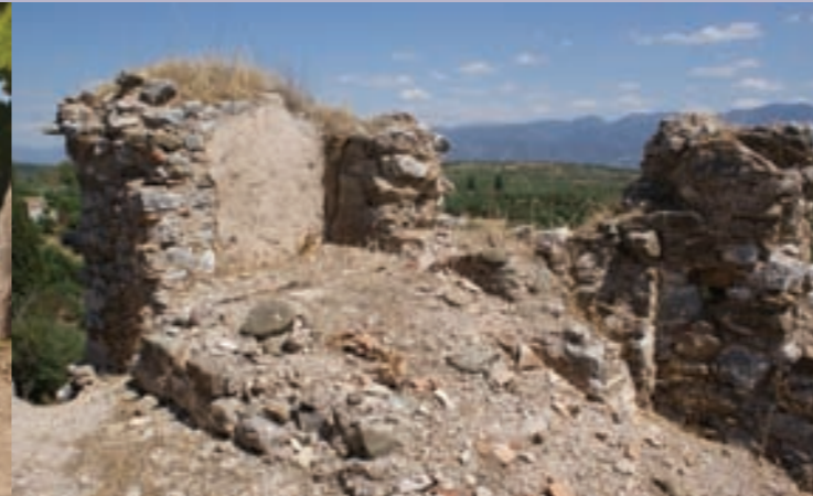
Η δεξαμενή στη δεύτερη στάθμη του νοτιοανατολικού πύργου The cistern at the second floor of the southeastern tower