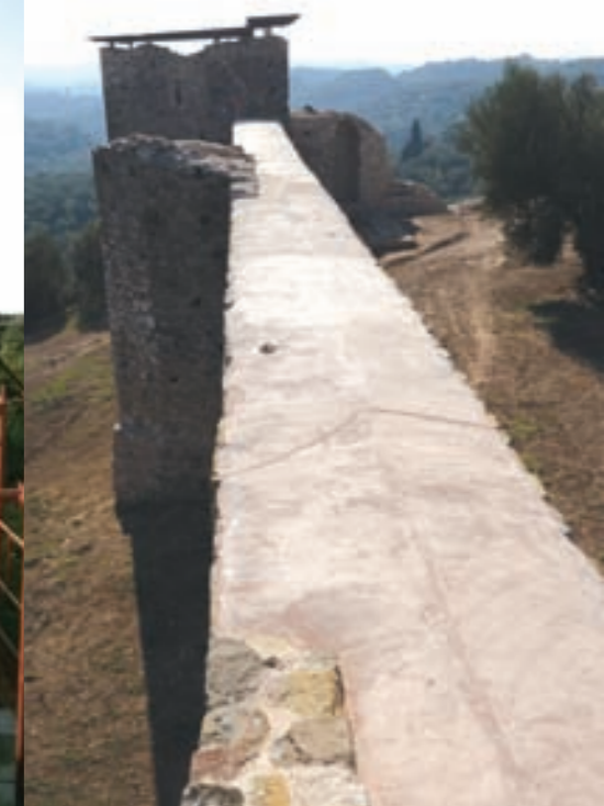
Ο περίδρομος του ανατολικού (επάνω) και του βόρειου τείχους (κάτω) πριν, κατά τη διάρκεια, και μετά τις εργασίες αποκατάστασης The rampart-walk of the eastern (above) and the northern (below) sections of the castle before, during, and after the restoration