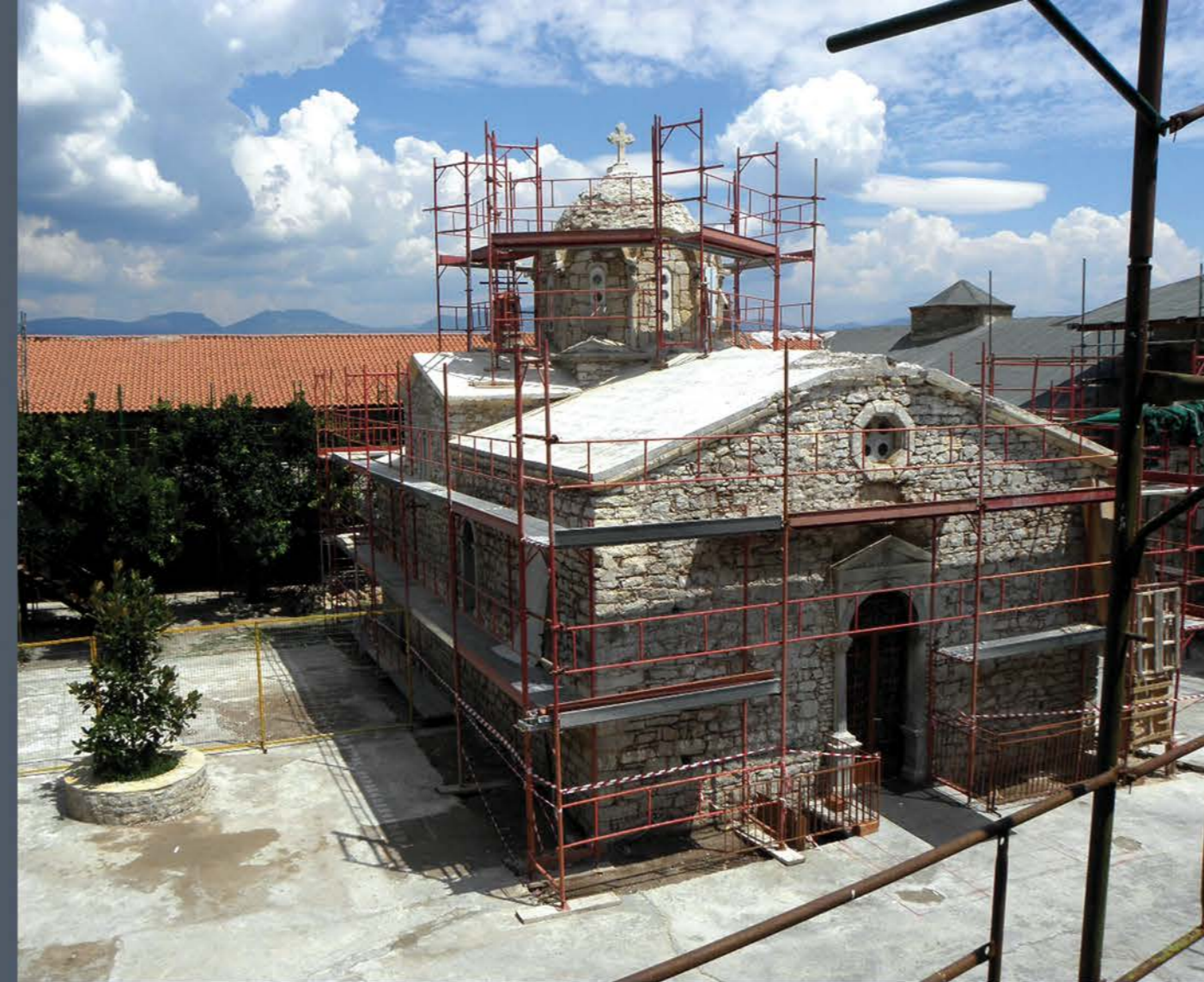
Άποψη του μνημείου μετά την καθαίρεση της παλαιάς κεράμωσης και των νεωτερικών τσιμεντοκονιαμάτων. View of the monument after the removal of the old roof tiles and the modern cement mortar.

The dome is in the form of the so – called Athenian type; it has an octagonal drum made of carved porous stone and adjoining a curved cornice of the same material. On the edges of the sides small porous stone columns are lined, crowned with capitals above which marble gutters are fixed.