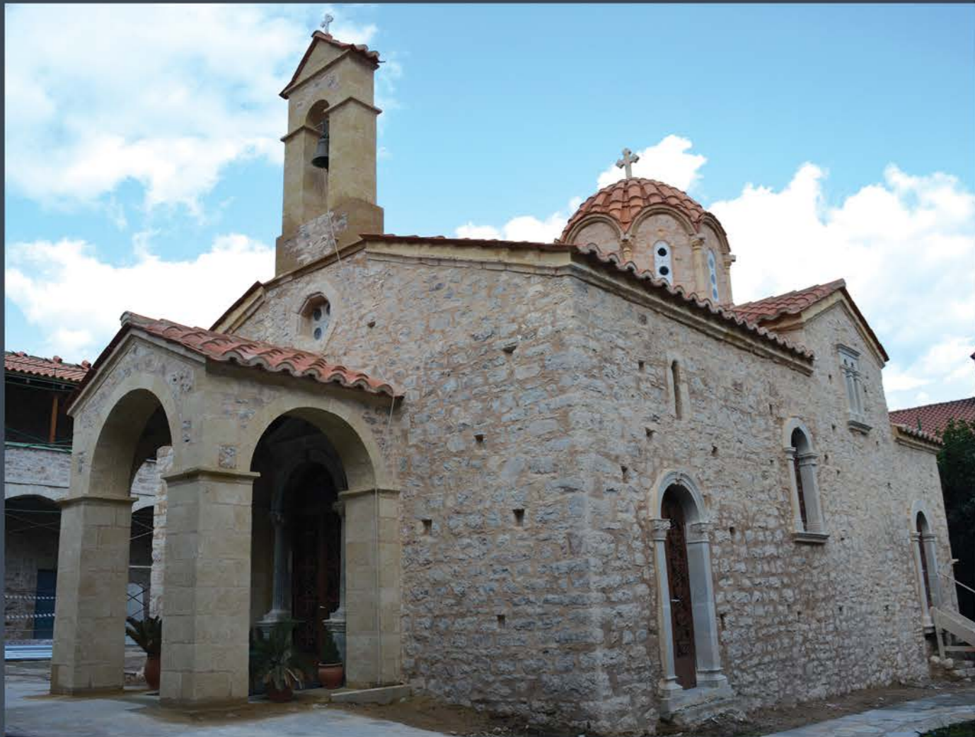
Άποψη του καθολικού μετά τις αναστηλωτικές εργασίες. View of the church after the restoration works.

The New Monastery of Voulkano, the most important monastery complex in Messenia, was founded on the 5th of March 1625, according to the manuscript codex of the Monastery. It is being located on a small plateau on the eastern part of the Eva Mountain (Haghios Vasilios), in a position controlling the Messenian valley. Until the foundation of the new monastery, the historical fraternity was settled on the top of Mount Ithome, that during the Middle Ages was renamed Voulkano or Vourkano, where the remnants of the old monastery, the so called Epanokastritissa, are still well preserved. The church of the new monastery was built in 1701, a date documented and supported by morphological and architectural evidence. The church is dedicated to the Assumption of the Virgin Mary and belongs to the two columned cross in square type, with three protruding apses to the east, all three-sided externally. The walls of the church and the original structure of the dome were revealed after the removal of the modern cement mortars that covered the external surfaces.