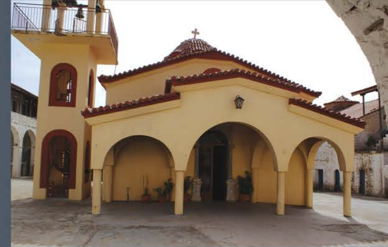
Η δυτική όψη πριν, κατά την διάρκεια και μετά το πέρας των εργασιών. The west side before, during and after the restoration works.