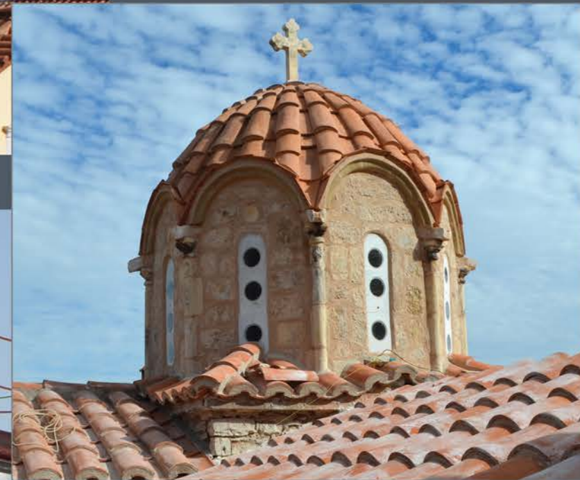
Ο τρούλος μετά την ολοκλήρωση των εργασιών αποκατάστασης. The dome after the completion of the restoration works.

Ο τρούλος ανήκει στον τύπο των λεγόμενων «αθηναϊκών». Διαθέτει οκτάπλευρο τύμπανο κατασκευασμένο από λαξευτούς πωρόλιθους και απολήγει σε καμπυλόγραμμο τοξωτό πώρινο γείσο. Στις ακμές των πλευρών του σχηματίζονται πώρινοι κιονίσκοι που επιστέφονται με κιονόκρανα, πάνω από τα οποία στερεώνονται μαρμάρινες υδρορροές.