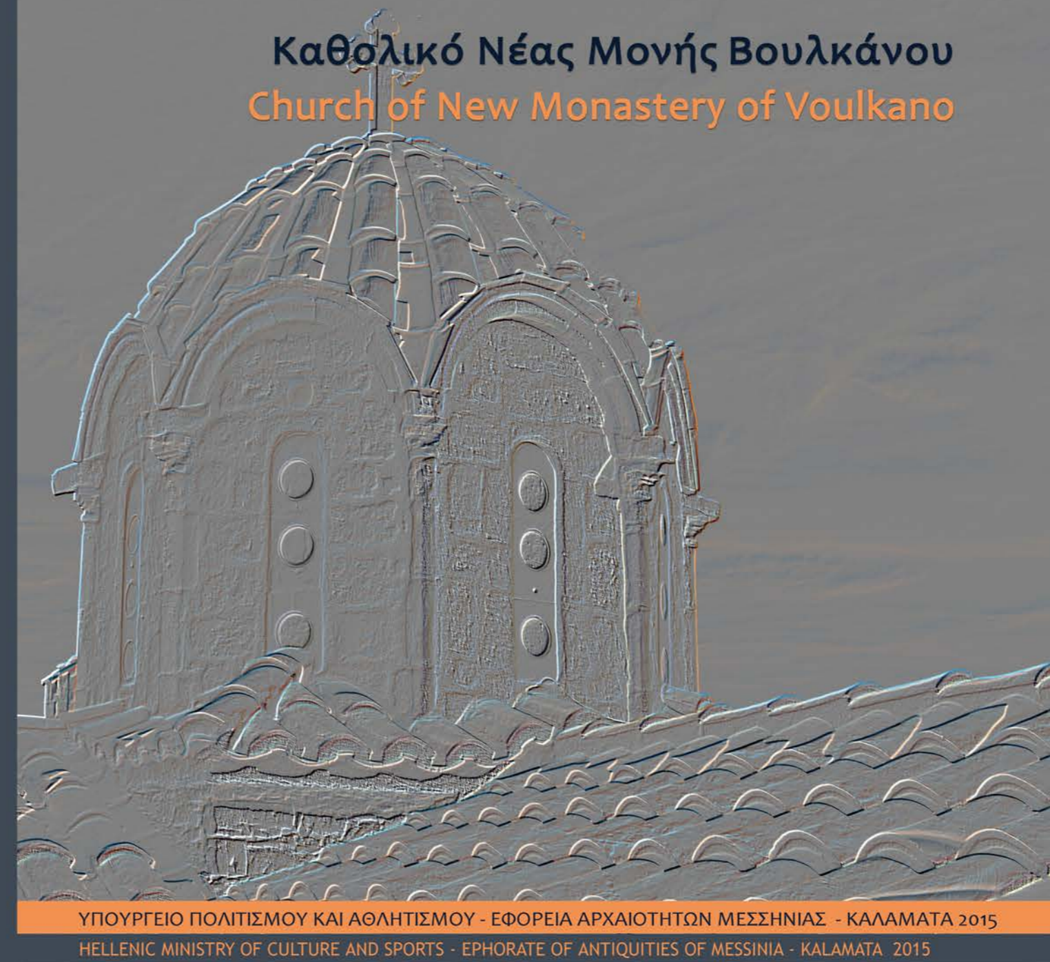
Άποψη του καθολικού πριν τις αναστηλωτικές εργασίες. View of the church before the restoration works.

Η Νέα Μονή Βουλκάνου, το σημαντικότερο μοναστηριακό καθίδρυμα της Μεσσηνίας, ιδρύθηκε στις 5 Μαρτίου του 1625, σύμφωνα με σημείωση στον χειρόγραφο κώδικα της Μονής, σε ένα μικρό πλάτωμα στο ανατολικό τμήμα του όρους Εύα (Άγιος Βασίλειος), που εποπτεύει τη μεσσηνιακή πεδιάδα. Έως τότε η ιστορική αδελφότητα ήταν εγκατεστημένη στην κορυφή του όρους της Ιθώμης, του μεσαιωνικού Βουλκάνου ή Βουρκάνου, όπου ακόμα διατηρούνται σε καλή κατάσταση τα κτηριακά κατάλοιπα της παλαιάς μονής, της επονομαζόμενης και Επανωκαστρίτισσας. Το καθολικό της νέας μονής κτίσθηκε το 1701 χρονολόγηση που τεκμηριώνεται βάσει πηγών, μορφολογικών και κατασκευαστικών κριτηρίων. Είναι αφιερωμένο στην Κοίμηση της Θεοτόκου και ανήκει στον τύπο των δικιόνιων σταυροειδών εγγεγραμμένων με τρούλο, με τρεις προεξέχουσες αψίδες στα ανατολικά, τρίπλευρες εξωτερικά. Μετά την καθαίρεση των νεωτερικών επιχρισμάτων που κάλυπταν τις όψεις του ναού αποκαλύφθηκε η τοιχοποιία του και η διάρθρωση του αρχικού τρούλου.