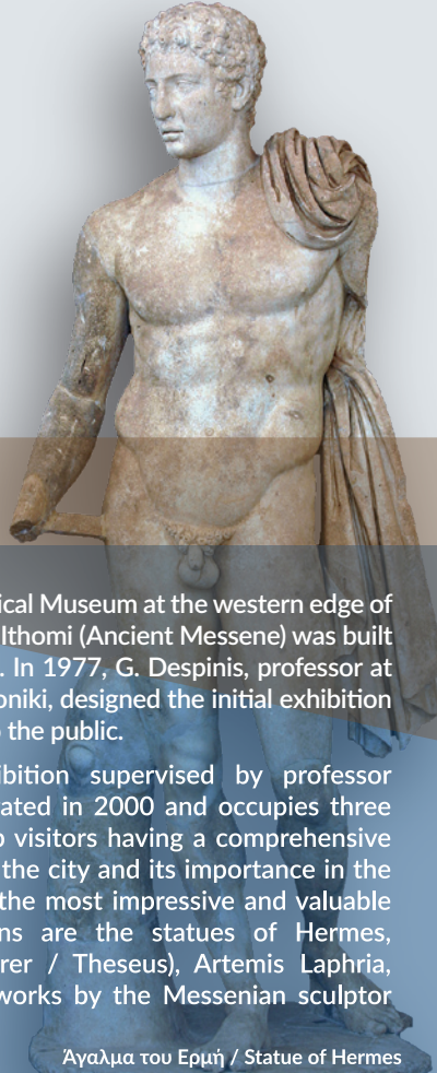
Άγαλμα του Ερμή / Statue of Hermes

Την οριστική έκθεση, που αναπτύσσεται σε τρεις αίθουσες και εγκαινιάστηκε το 2000, επιμελήθηκε ο καθηγητής Πέτρος Θέμελης. Μέσω των εκθεμάτων, επιχειρείται να δοθεί στον επισκέπτη μια σφαιρική εικόνα της ιστορικής εξέλιξης της πόλης αλλά και της σημασίας της στον αρχαίο κόσμο. Μερικά από τα πλέον εντυπωσιακά και αξιόλογα ευρήματα των ανασκαφών είναι τα αγάλματα του Ερμή, του Δορυφόρου (Θησέα), της Αρτέμιδος Λαφρίας, της Ίσιδος Πελαγίας καθώς και τα έργα του Μεσσηνίου γλύπτη Δαμοφώντος.