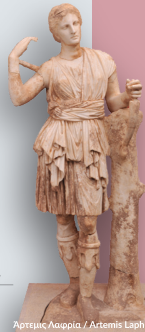
Αρτεμις Λαφρία / Artemis Laphria

Ο ΑΡΧΑΙΟΛΟΓΙΚΟΣ ΧΩΡΟΣ ΚΑΙ ΤΟ ΜΟΥΣΕΙΟ THE ARCHAEOLOGICAL SITE AND THE MUSEUM