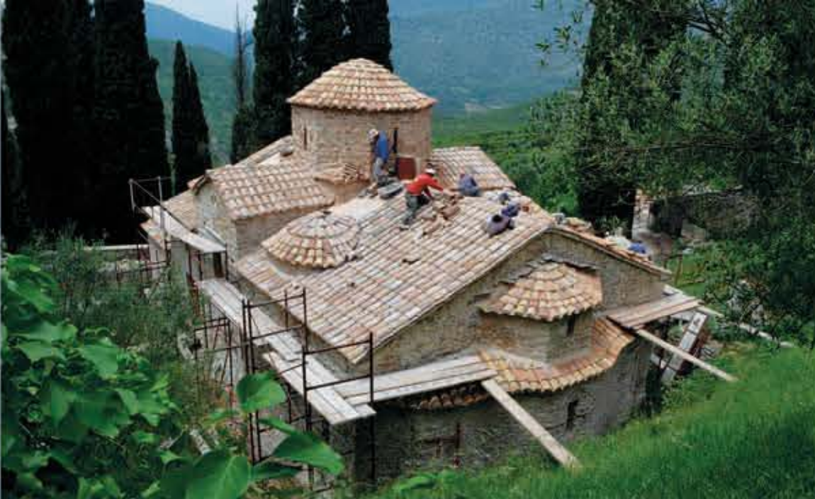
Άποψη του μνημείου κατά τη διάρκεια και μετά την ολοκλήρωση των εργασιών αποκατάστασης The church during and after the restoration works.