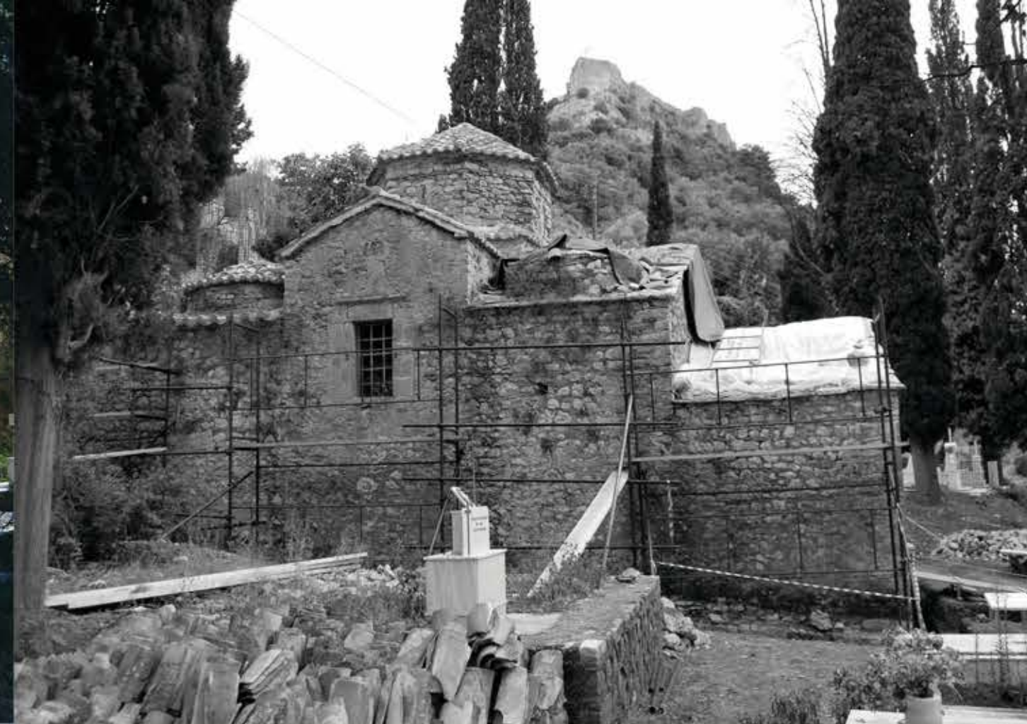
Βόρεια όψη του ναού πριν τις αναστηλωτικές εργασίες. North facade of the church before the restoration works.

The church of Haghios Nikolaos is located on the northwest outskirts of Karytaina. It is a cross-in-square complex four columned church, with a modern narthex attached at the west. Three three-sided apses protrude at its eastern part. The arms of the cross are covered by semicircular barrel vaults, while the rectangular corner bays are covered by small domes. Due to this feature the monument is ascribed to the rare architectural variant of the five-domed churches. A wooden 19th c. templon screen separates the sanctuary from the nave. Its structural and morphological features indicate that the building was erected in the early 18th c. The church of Haghios Nikolaos is one of the most important post-Byzantine monuments of the region and related to the prosperity of the town during the 17th and 18th centuries.