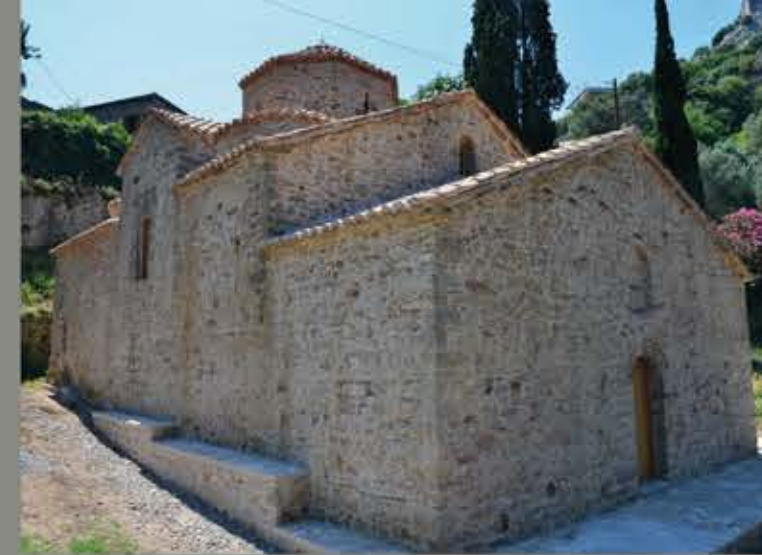
Άποψη του ναού μετά τις αναστηλωτικές εργασίες. Κάτοψη του μνημείου. View of the church after the restoration works. Ground plan.